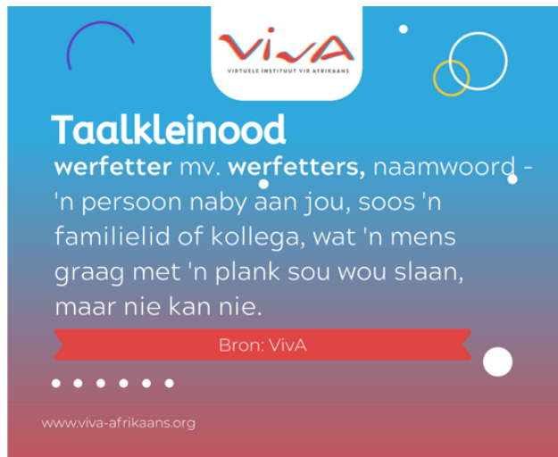
Figuur 1. Betekenis van die woord werfetter (Viva Facebookblad, 5 Maart 2021)

Die woord was vir sommige kommentators onbekend, terwyl ander eerder sou swets as om dié woord te gebruik omdat dit “kru” of “een van die aakligste woorde” is, veral in die Noord-Kaap. Dus het ek gepor: