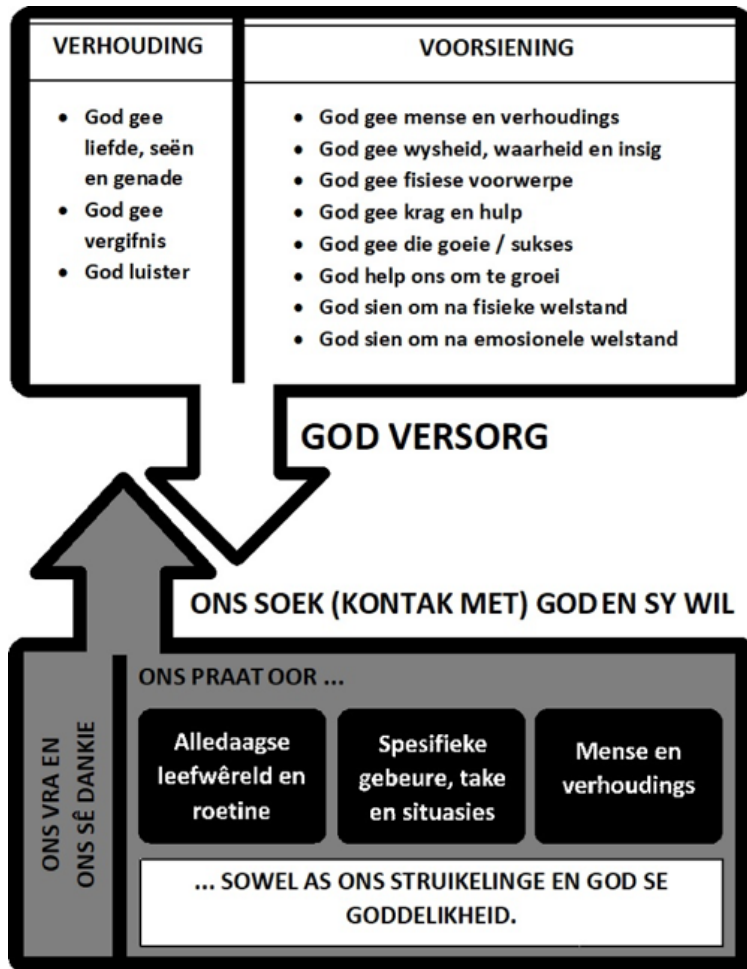
Figuur 1. Aksiale kodering met “God versorg” as kern-kategorie

God versorg bestaan uit twee komponente, naamlik die voorsienende rol van God en die verhoudingskomponent.