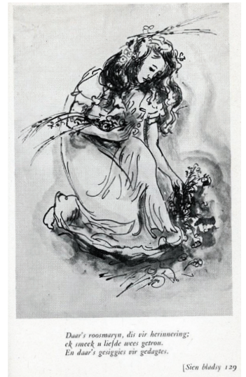
Daar's roosmaryn, di vir herinnering; ek smek u liefde wees getrou. En daar's gesiggies vir gedagtes.