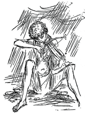
DIE LIED VAN DIE REEN 'n Koranna-dwaal storie