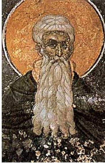
Illustrasie 3. Nog 'n ikoon van die askeet vader Arsenios met sy grys-wit baard en hare

Net soos Bryan Green (1993:1–3), benader ek die verskynsel van bejaardheid in hierdie studie as 'n diskoers (die gerontologiese diskoers, of gerontologie). Ons gebruik die terme bejaardheid , en ook gerontologie , om te praat oor die individuele en gemeenskaplike liggaam. Soos Stephen Katz (1996:1) ook noem, is bejaardheid deel van elke vorm van kennis en alle kulturele praktyke, insluitend geestelike, rituele, mitiese, simboliese, kunstige, metaforiese, en selfs argitektoniese praktyke. Bejaardheid kan nie vervat word in een vasgestelde locus nie. Die betekenis van bejaardheid is veelvoudig, en elke kultuur toon 'n unieke blik op bejaardheid. Vir party mense is die ouderdom van 60 of 70 jaar die begin van die tydperk van bejaardheid in die lewe, terwyl ander in die geskiedenis hulself al op 40-jarige ouderdom as bejaard beskou het (Lamirande 1982:227–33; Parkin 2004:17–8). Ons moet dus Green (1993:13–25) se waarskuwing ernstig opneem dat bejaardheid en gerontologie nie slegs met 'n biologiese verskynsel te doen het nie, maar ook sosiaal gekonstrueerd is (Stoneking 2003:63–89).