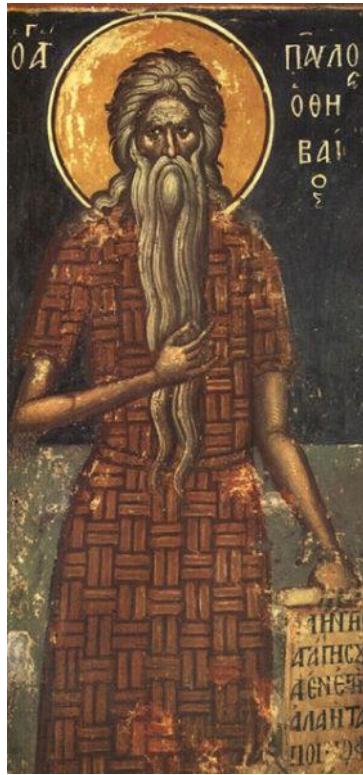
Illustrasie 1. Die bejaarde Sint Paulus die Kluisenaar met sy lang grys baard (oorgeneem uit WordPress; https://citydesert.files.wordpress.com/2014/01/paul-the-hermit.jpg )

Testament, maar dit word dikwels bespreek binne die konteks van leierskapstrukture in die vroeë Christendom, en daar is reeds aangetoon dat 'n ouderling in die vroeë kerk nie noodwendig 'n bejaarde hoef te gewees het nie. 3