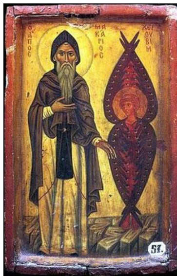
Illustrasie 2. 'n Icoon van die askeet vader Makarios van die Sint Katarina-klooster in Sinai, Egipte, met sy lang wit baard, langs 'n gerub (Wikimedia Commons 2009; https://commons.wikimedia.org/wiki/File:St_Macarius_the_Great_with_Cherub.jpg )