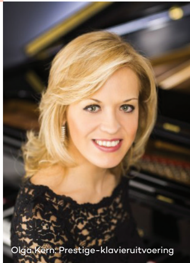
Olga Kern: Prestige-klavieruitvoering

Die Russies-Amerikaanse pianis Olga Kern word tans erken as een van haar generasie se uitnemendste pianiste. Sy het in die kalklig gekom as die eerste vrouepianis in meer as 30 jaar om die goue medalje by die Van Cliburn Internasionale Klavierkompetisie te verower. Haar verowering van die eerste prys in die Internasionale Rachmaninoff-kompetisie op 17-jarige ouderdom was die begin van 'n glorieryke kompetisie-loopbaan. In 2016 het sy gedien as beoordelaarsvoorsitter van sowel die sewende Van Cliburn Internasionale Amateur-klavierkompetisie en die eerste Olga Kern-klavierkompetisie, waarvan sy ook die artistieke direkteur is. In hierdie prestigeryke solo-uitvoering speel sy werke soos Schumann se Karnaval , Gershwin se Drie Preludes en 'n transkripsie van Gershwin se Fascinating Rhythm , sowel as musiek van Rachmaninoff, Skriabin en Balakiref.