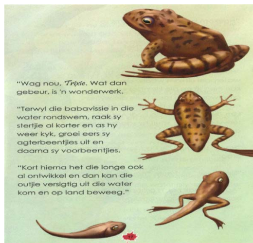
Figuur 4. Dit sukkel maar op land (bl. 17). Toestemming vir gebruik is op 19 Junie 2017 deur die uitgewer verleen.

Dieselfde kan gevolglik oor die kriterium van Mayer (1995:18–9), naamlik die “natuurlike” voorstelling van diere, geopper word. Daar is weinig illustrasies van diere en plante in die reeks, maar dié wat wel voorkom, is nie wetenskaplik of feitelik lewensgetrou nie. Alhoewel nie noodwendig verkeerd nie, is die voorstelling ietwat geanimeerd en karikatuuragtig. (Sien byvoorbeeld die illustrasies van ’n padda of die voorstelling van die kuikens en die muis hier onder.)