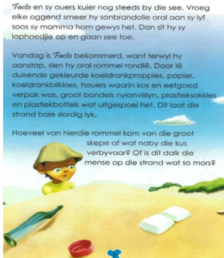
Figuur 1. Besoedeling. Biodiversiteit in gevaar , Schreuder 2010u:2. Toestemming vir gebruik is op 19 Junie 2017 deur die uitgewer van die reeks verleen.

Die formaat van fiksietekste vir kinders bied sekere unieke voordele bo teoretiese handboeke om leerders in 'n wetenskaples geïnteresseerd te kry, want dit stimuleer leerders op sowel emosionele as intellektuele vlak. Alhoewel die boek in die leesreeks nie prenteboeke is nie, maar wel funksionele, opvoedkundige tekste, is dit kleurvol geïllustreer. In die onderstaande illustrasie byvoorbeeld word 'n seun uitgebeeld waar hy na rommel wat op die strand gestrooi lê, staar. Hierdie illustrasie beeld die konsep van besoedeling uit en dit spreek ook tot die leser se gewete, aangesien die seun ( Facto ) se kommer (emosie) in teks en in illustrasie manifesteer.