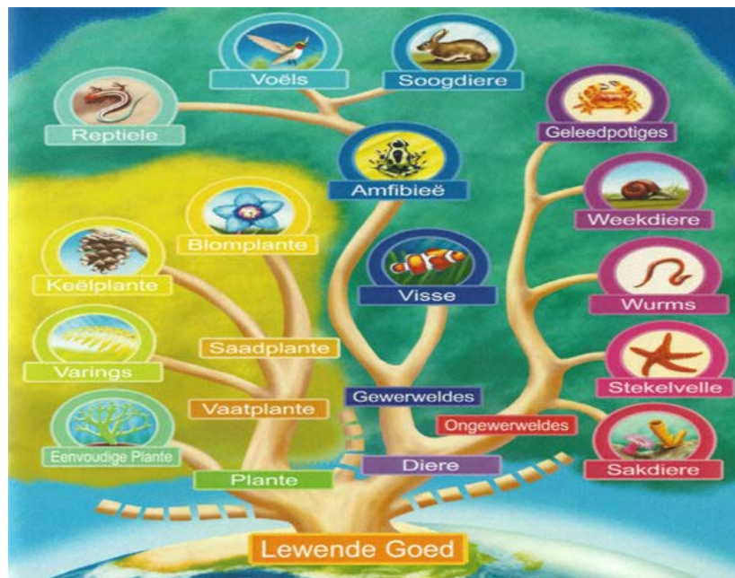
Figuur 2. Lewende goed. Name en nisse, Schreuder, 2010g:13. Toestemming vir die gebruik van die illustrasie is op 19 Junie 2017 deur die uitgewer verleen.

Die illustrasie onder is 'n kleurvolle voorstel van die netwerk van lewende dinge: