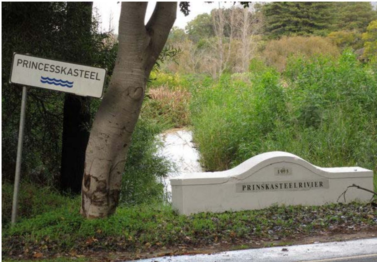
Figuur 1. Gebrekkige geskiedkundige kennis weens onvoldoende navorsing het tot gevalle van foutiewe naamgewing in die Tokai-omgewing gelei. Op die foto word 'n geografiese pleknaam op verskillende wyses gespel, waarvan nie een geskiedkundig korrek is nie. 2