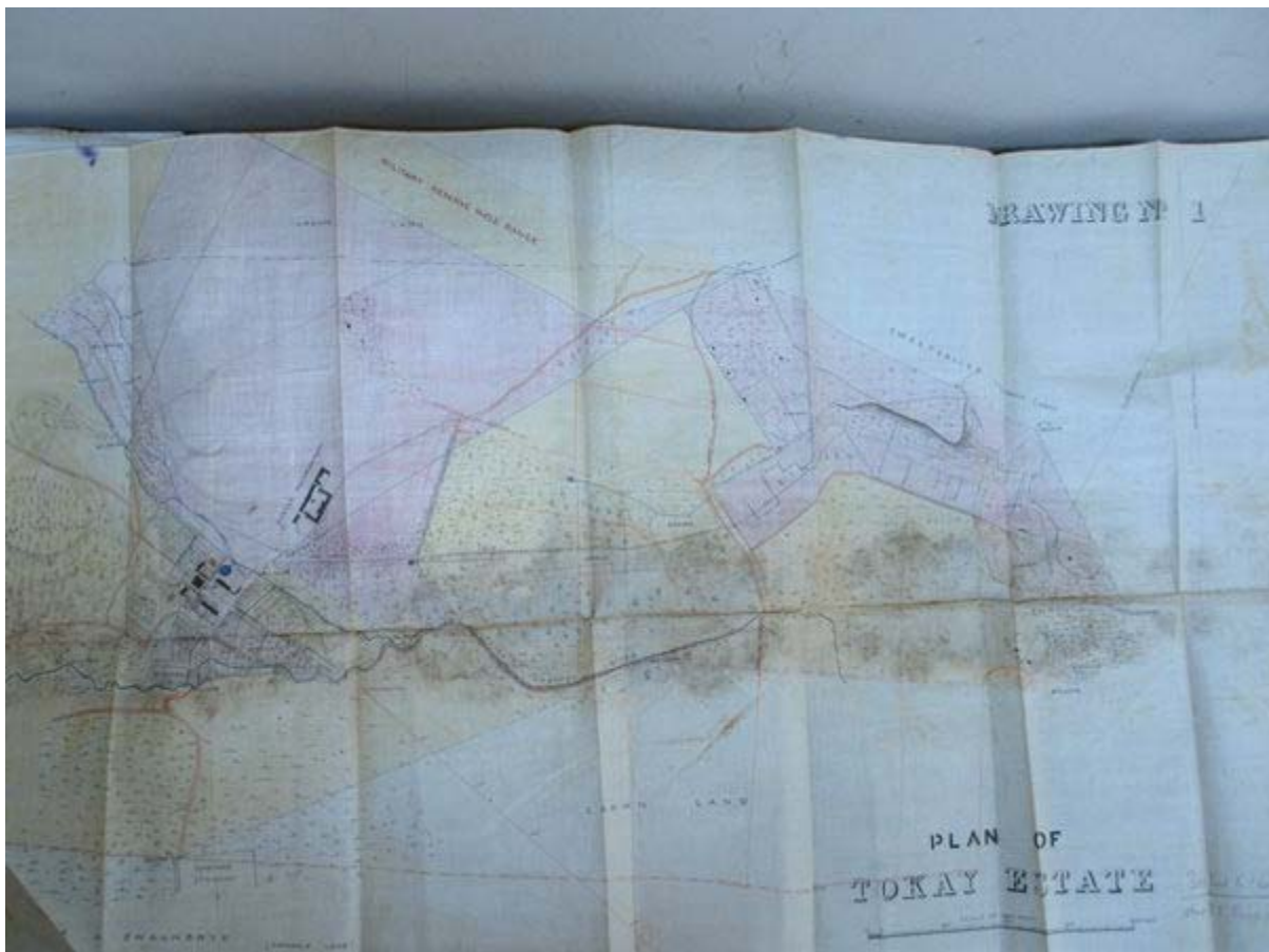
Figuur 5. Hierdie kaart van die Tokaiwerf en omliggende terrein, soos in 1893, toon in vergelyking met die ouer kaarte hoe die terrein verander het om by verskillende soorte