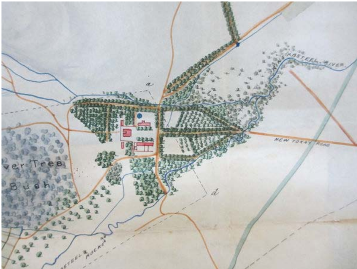
Figuur 4. 'n Kaart van Tokaiwerf in 1885, kort nadat die fase begin het waarin die grond weer vir bosbou doeleindes gebruik is. Deeglike bestudering van en vergelyking tussen geskiedkundige kaarte uit verskillende tydperke verskaf andersins onverkrygbare inligting oor verskillende soorte erfenis op die terrein. 6