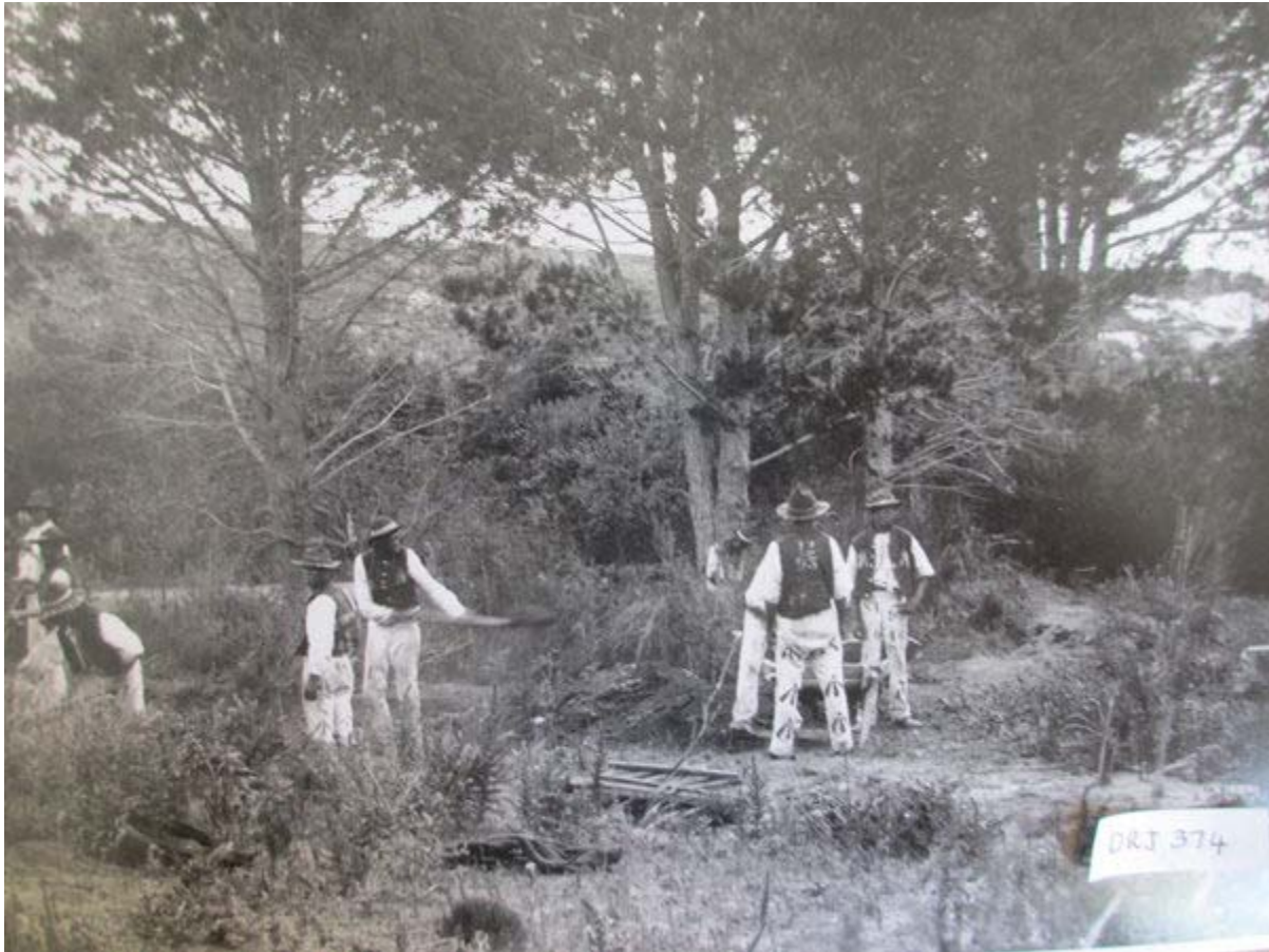
Figuur 6. Dwangarbeiders werk in die Tokaiplantasie, ca. 1896. Die riglyne in die Burrahandves en die Wet op Nasionale Erfenishulpbronne beklemtoon dat alle belanghebbers wie se voorsate by 'n erfenisplek gewoon en gewerk het, se erfenis in erfenisbestuur verreken moet word. In die geval van Tokai is verdere navorsing oor die rol van die Khoina, slawe en arbeiders nodig ten einde reg te laat geskied aan alle belangegroepse se erfenis in hierdie omgewing. 8