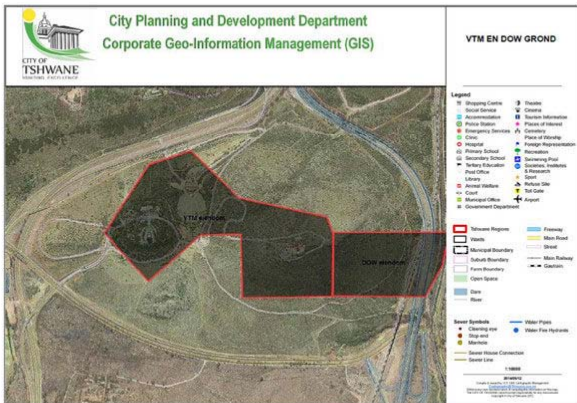
Figuur 3. Kaart van die Voortrekkermonument-terrein. Die linkerkantse gedeelte in rooi bely behoort aan die Voortrekkermonument-maatskappy, maar is groter as 15 hektaar. Dit bestaan uit twee subgedeeltes, albei groter as 15 hektaar. Die eerste is gedeelte 12, 13 en 24 van die plaas Groenkloof 358 JR en huisves die monument, amfiteater en ander historiese strukture. Die tweede is gedeelte 9 van die plaas Groenkloof 358 JR en huisves Fort Schanskop. Ander gebiede behoort aan die Departement Openbare Werke en die Stad Tshwane (Stad Tshwane, Departement Stadsbeplanning en Ontwikkeling).

Daar moet dus altyd wyer gekyk word. So het die Voortrekkermonument-bestuur self in hulle motivering vir die verklaring aandag gegee aan die uitgebreide stelling van belang (Statement of significance) van die monument. In hierdie dokument word onder meer strukture soos die klipstapel van 1938, die amfiteater, die voorstelling van trekroetes oos van die monument en replikas van Zoeloe hutte vermeld. Aandag word ook aan die nietasbare erfenis verleen met die vermelding van die Simboliese Ossewatrek van 1938 en die gebeure tydens die hoeksteenlegging van die monument (Kruger 2006; Kruger 2010b:1–7). Dit is gevolglik duidelik dat die groter geheel in ag geneem moet word.