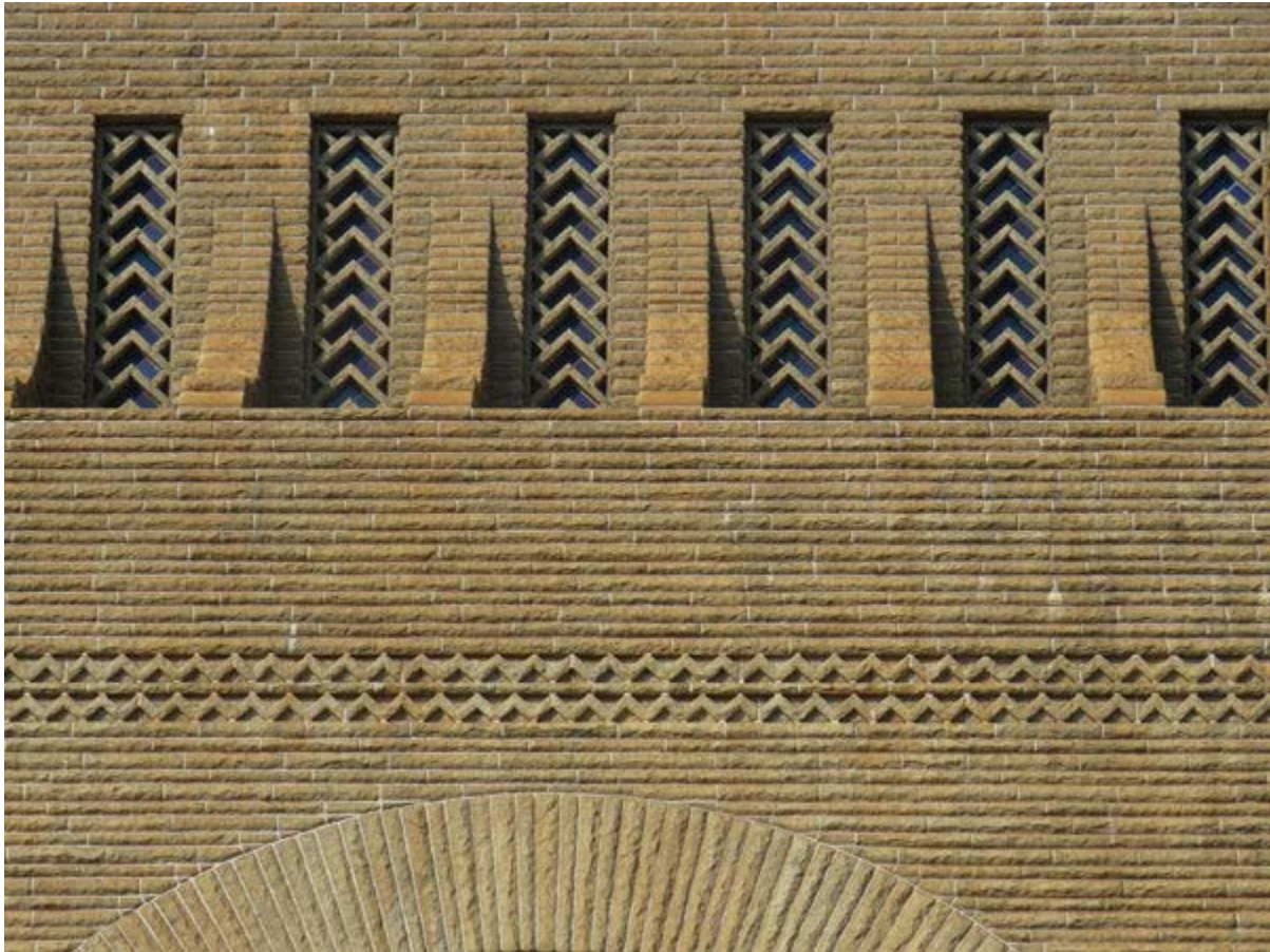
Figuur 2. Die sigsagpatroon aan die buitekant van die Voortrekkermonument.

Mapungubwe. Daar is egter geen inligting wat daarop dui dat Moerdyk die monument hierdeur 'n wyer simboliese betekenis wou gee as dit wat hier bo vermeld is nie. Inteendeel, die 1938-fees het 'n uitsluitlik Afrikaanse karakter gehad, wat negatief deur ander groepe ervaar is (Ferreira 1975:103–5; Marschall 2005:25). Tog bly die insluiting van Afrika-elemente 'n aspek wat met vrug tot 'n verbreding in interpretasie benut kan word.