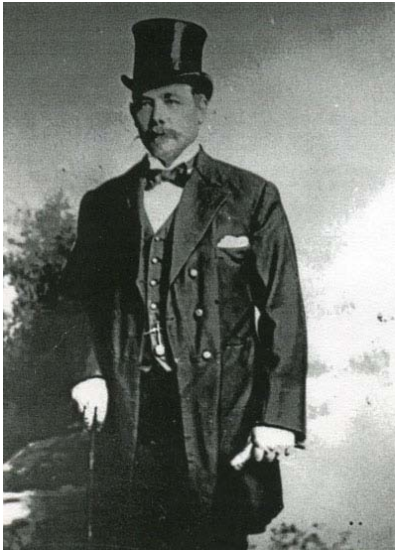
Figuur 1. D.E. Schutte, eerste kommandant van die Johannesburgse polisie

There is very little in his letter which was not either known or suspected before; but Mr. Schutte's position enables him to dot the i's and cross the t's of an indictment which the public press has not hitherto been in a position to formulate with anything like the same definiteness or precision, and his revelations are sufficiently explicit to show very clearly where and why the boot pinches. 21