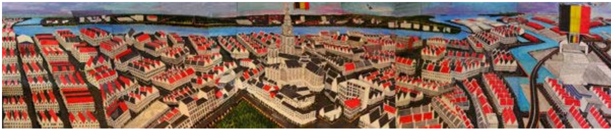
Figuur 1. Titus Matiyane, Panorama of Antwerp , 2014. Gemengde media op Fabriano, 140 x 600 cm.

beskou kan word en tweedens as 'n simptoom van 'n begeerte na wording, simulakrum en transendensie.