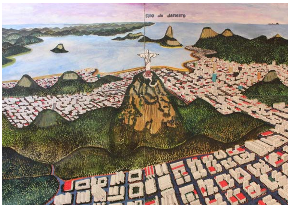
Figuur 5. Titus Matiyane, Panorama of Rio de Janeiro (detail), 2013. Gemengde media op Fabriano, 120 x 1 000 cm.