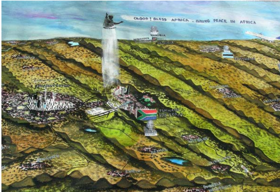
Figuur 8. Titus Matiyane, Panorama of Africa, Cape to Cairo (detail), 2015. Gemengde media op Fabriano, 120 x 800 cm.

Alhoewel flâneurie en bemagtigingsaksies in die verbeelding van die kunstenaar geskied, impliseer die aanskouing van Matiyane se panoramas tog ook fisiese flâneurie van die aanskouer deurdat sommige van sy panoramas tot 4 600 cm beloop ( Panorama of Pietersburg to Sasolburg , 2004) en die totale beswaarlik in 'n enkele oogopslag ingeneem kan word. Dit vereis van die kyker 'n fisiese handeling van loop langs die werk verby, byna soos die flâneur in die stadsomgewing verby 'n winkelvenster of op 'n sypaadjie loop.