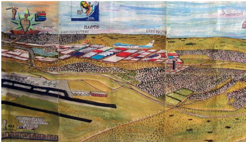
Figuur 3. Titus Matiyane, Panorama of Gauteng (detail), 2010. Gemengde media op Fabriano, 120 x 350 cm.

Wat betref sy blote keuse van onderwerpsmateriaal – groot stede van die wêreld – asook die stilistiese tegniek en die rol van sy verbeelding, word ’n behoefte aan ’n identiteit wat groter en glansryker is as die plaaslike identiteit uitgedruk. As sulks ontstaan daar visuele spanning tussen die sogenaamde “korrekte” dokumentasie van die stad – waarvan die kunstenaar oortuig is – en die konseptuele implikasies onderliggend aan die gebrek aan korrektheid. Matiyane se keuses spreek van persoonlike vertolking, subjektiewe kommentaar en dikwels ’n emosionele beleving van die geografie, ’n situasie of gebeurtenis. Hy oorkom só die beperkinge van koloniale en apartheidserfenisse en -politiek wat hom weerbaar gelaat het in Atteridgeville, en op optimistiese wyse omarm hy wel sy identiteit as deel van ’n spesifieke geografie en geskiedenis, maar hy probeer hom ook doelbewus daarvan distansieer. Die kunstenaar skep sodoende ’n veelvlakkige integrasie met die geskiedenis van apartheid in Suid-Afrika, wat nie net beheer in terme van plek en beweeglikheid behels het nie, maar ook die regte van die individu aangetas het; meer nog, karteer hy op skynbaar meganiese en neutrale wyse die argitektoniese en geografiese impak van apartheid. 12