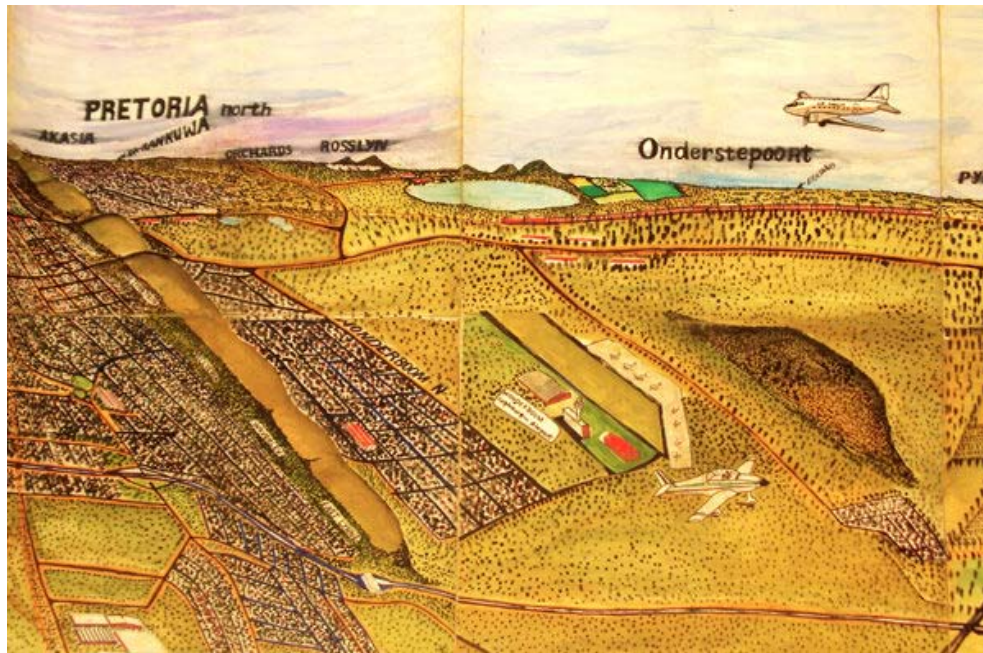
Figuur 6. Titus Matiyane, Panorama of Gauteng (detail), 2010. Gemengde media op Fabriano, 120 x 350 cm.