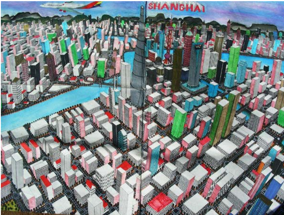
Figuur 7. Titus Matiyane, Panorama of Shanghai (detail), 2016. Gemengde media op Fabriano, 120 x 130 cm.

simulakrum deur middel van die uitvoering van kunsmatige, ideale identiteit en grensuitwissing.