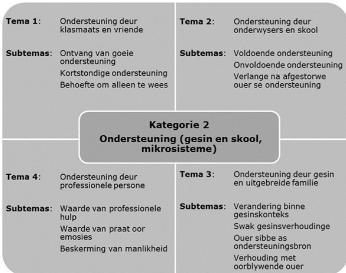
Figuur 5. Kategorie 2: Ondersteuning (gesin en skool, mikrostelsels)

'n Tweede kategorie waaraan aandag in die ondersoek gegee is, is die ondersteuning wat die adolessente uit hulle direkte omgewing ontvang het. Vier temas en verskeie subtemas, naamlik ondersteuning deur klasmaats en vriende, ondersteuning deur onderwysers en die skool, ondersteuning deur professionele persone en ondersteuning deur die gesin en uitgebreide familie (figuur 5) is uit die versamelde data verkry.