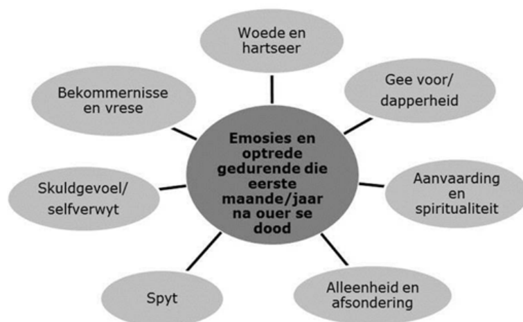
Figuur 3. Emosies en optrede gedurende die eerste maande/jaar na die oer se dood

Die tweede tema (figuur 3) gee 'n aanduiding van die seuns se emosionele reis ná die dood van hulle moeders en sluit elemente van die tradisionele siening van rouverwerking in.