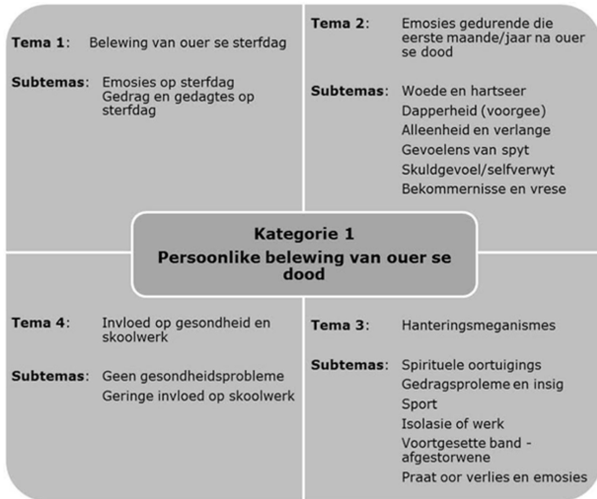
Figuur 1 . Kategorie 1: Persoonlike belewing van ouer se dood

Figuur 1 is 'n samevattende voorstelling van die deelnemers se persoonlike belewing van die dood van 'n ouer. Vier temas het ter sprake gekom, naamlik die belewing van die ouer se sterfdag, emosies gedurende die eerste maande/jaar na die ouer se dood, die hanteringsmeganismes wat die seuns gebruik het en die invloed van die dood van die ouer op die deelnemer se gesondheid en skoolwerk.