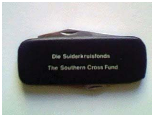
Figuur 2b. Suiderkruisfonds-mes: 'n gunsteling onder die soldate