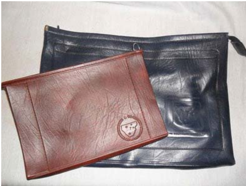
Figuur 2a. Suiderkruisfonds-leersakkies waarin benodighede vir soldate geplaas en oorhandig is.

Die sekondêre doel van die organisasie was om die moreel van die gewapende magte hoog te hou deur die burgerlike gemeenskap agter die weermag en polisie te verenig. 26 Albrecht het inderdaad die doelstellings van die fonds soos volg opgesom: “[The fund is] the channel between the people and the forces, who receive in this way not only recreational equipment, but also the assurance of the gratitude and moral support of the people at home” (in Conway 1989:80). Soos die fonds se aktiwiteite uitgebrei het, het ook die komitee en ledetal uitgebrei. Jaarliks is al hoe meer takke in elke provinsie gestig. In die Kaapprovinsie alleen was daar 127 takke en in die destydse Transvaal 71 takke. Tydens sy bestaan het die Suiderkruisfonds net meer as 300 takke landswyd gehad. 27