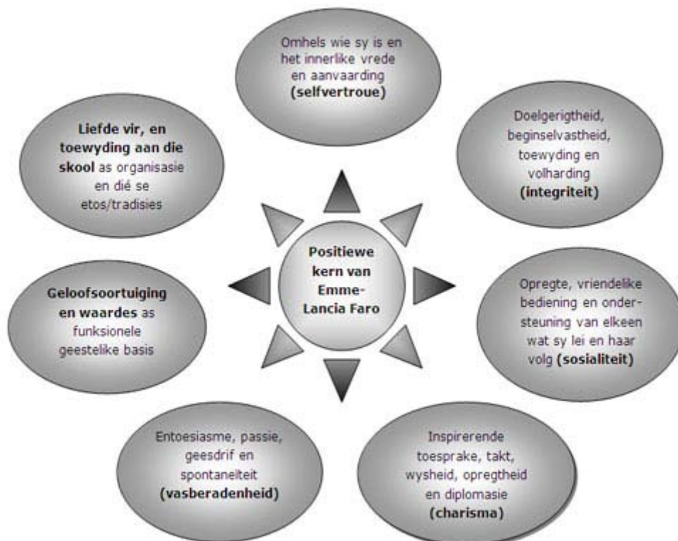
Figuur 6. Sewe positiewe temas of hoedanighede van Faro se leierskap: die positiewe kern van 'n uitmuntende hoofmeisie

In die beskrywings in Tabel 3, soos geselekteer uit Northouse (2012:22-33), word al Faro se ander hoedanighede ook weerspieël. Al die eienskappe van 'n charismatiese leier wat in die inleiding met verwysing na Northouse (2012:30) aangedui is, is by haar herkenbaar. Sodoende word dit moontlik om haar leierskapsprofiel ook in te bed of te vestig in die jongste akademiese vakliteratuur. Daarmee saam word die besluit om haar as positiewe rolmodel te bestudeer en aan te bied ook bekragtig.