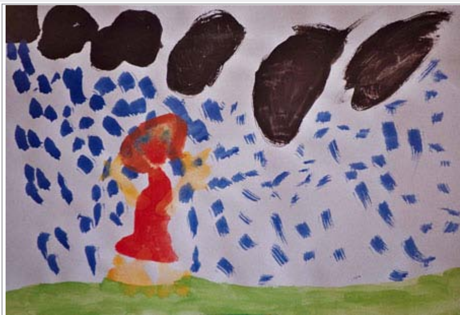
Figuur 6. Prent 6: Terminerings-/oplossingsfase

Tydens die laaste fase van die reekstekeningmodel begin die kind om haar libidinale energie van die terapeut te onttrek (Allan 1988:41). In Jungiaanse terme verwys libido na psigiese energie en moet dit daarom nie met Freud se siening, wat libido en seksuele energie gelykstel, verwar word nie (Chalquist 1997:5). Elemente aanduidend van losmaking van die terapeut het nie spesifiek in die prente van die kind na vore gekom nie.