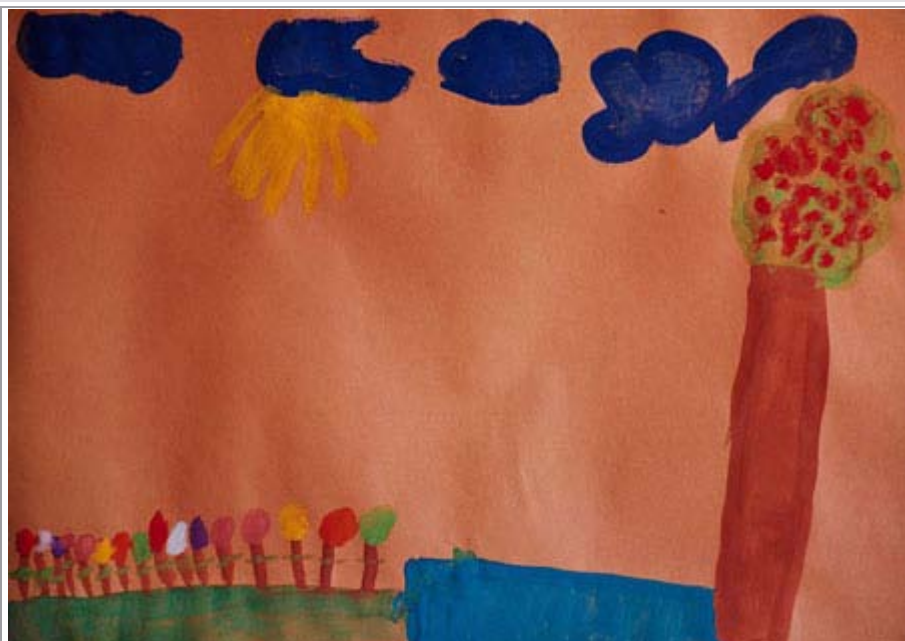
Figuur 4. Prent 4: Middel-/worstelingfase