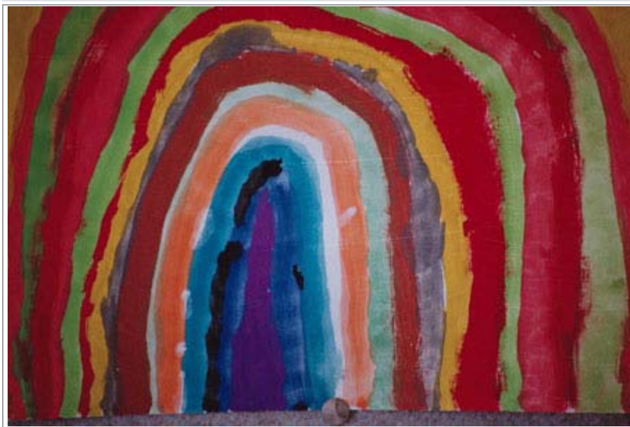
Figuur 7. Prent 7: Terminerings-/oplossingsfase