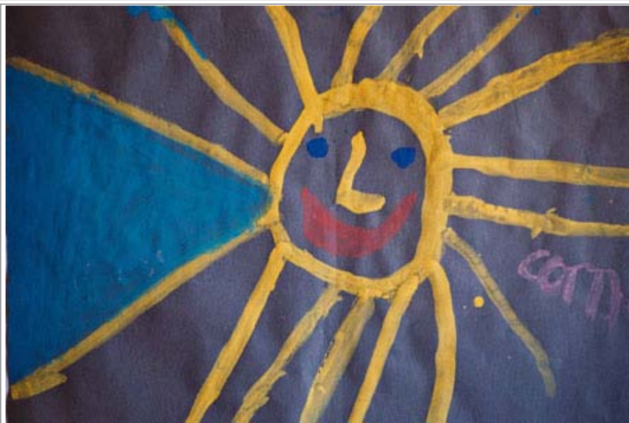
Figuur 3. Prent 3: Middel-/worstelingfase

Tydens die middelfase het haar moeder en 'n onderwyser geverbaliseer dat haar negatiewe gedrag aan die afneem was. Sy het makliker met maatjies gesosialiseer en sy het ook minder baklei. Dit het met ander woorde geblyk dat die terapeutiese proses op daardie stadium van die kind se lewe besig was om sy doel te dien en dat die termineringsfase van die reekstekeningmodel betree kon word.