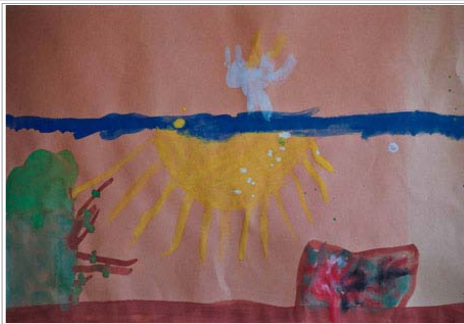
Figuur 2. Prent 2: Begin-/chaotiese fase